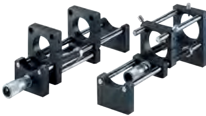
Mounting example of Rod holder and Rod holder G with micrometer