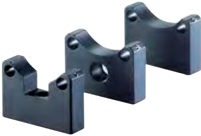
Ahead: Rod holder F Middle: Rod holder G Back: Rod holder